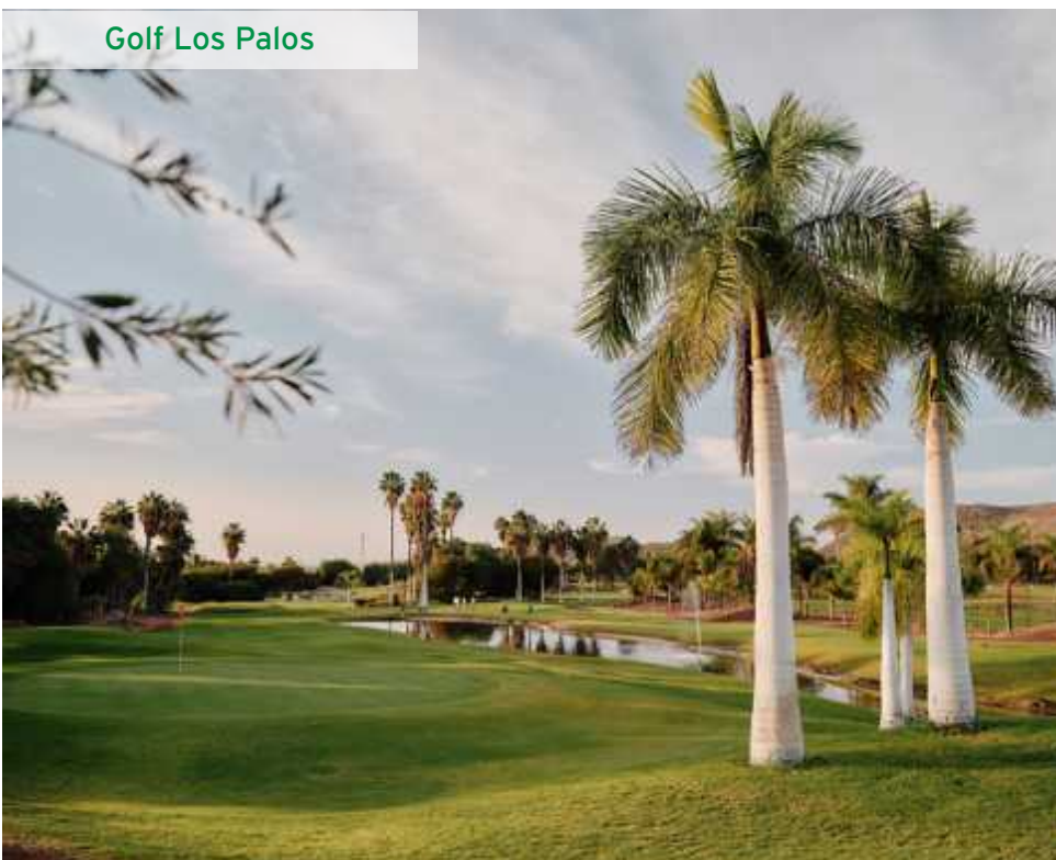
Golf Los Palos

Darüber hinaus gibt es auf Teneriffa noch die kleineren 9-Loch-Plätze Centro de Golf Los Palos , La Rosaleda und Los Lagos - ideal für Anfänger oder zur Verbesserung des kurzen Spiels. ■