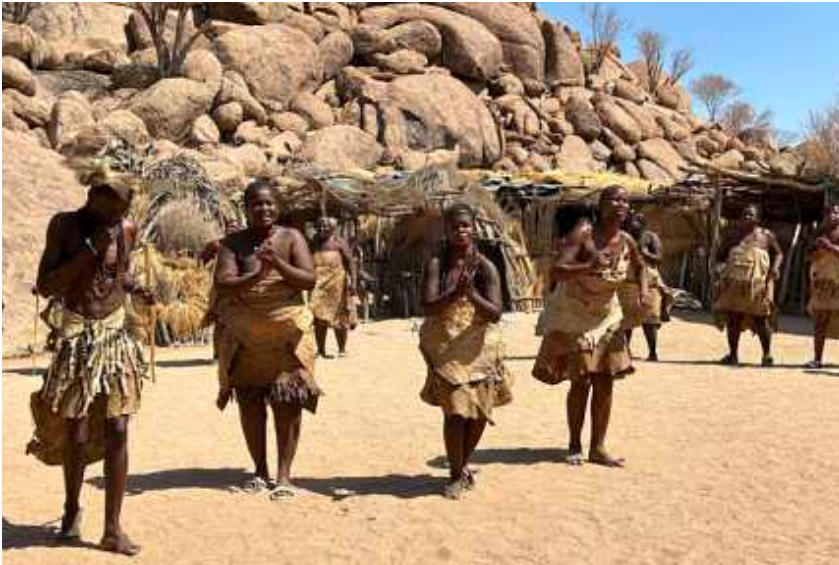
↓ Felsgravuren von Twyfelfontain