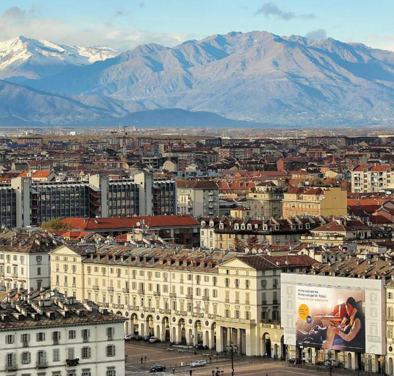
↑ Hoch hinaus wollten die Turiner bereits im 19. Jahrhundert: Das Wahrzeichen und Filmmuseum Mole Antonelliana überragt die Stadt in den Alpen

Historische Fassaden, glamouröse Paläste, köstliches Essen und bunte Kaffeehauskultur: Italien wie aus dem Bilderbuch findet man in Turin. Im Gegensatz zu Venedig oder Florenz ist die norditalienische Stadt auch nicht von drängelnden Touristengruppen überlaufen. Und die smarte City blickt nicht nur auf eine glanzvolle Geschichte zurück, sondern hat sich zum Innovationszentrum Italiens entwickelt. Eva Meschede hat sich umgesehen.