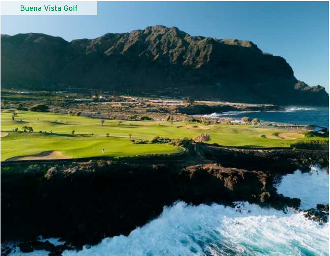
Buena Vista Golf