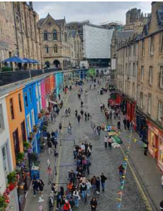
↑ Edinburghs Victoria Street