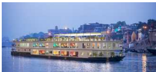
RV Thurgau Ganga Vilas auf dem Mekong

Alleine zu reisen ist längst kein Nischenphänomen mehr. Flussreisen bieten ideale Voraussetzungen für Soloreisende: überschaubare Gästezahlen, gemeinsame Mahlzeiten, geführte Ausflüge und viel Raum für spontane Gespräche. Der Flussreisen-Spezialist Thurgau Travel greift diese Entwicklung auf und baut sein Angebot für Alleinreisende für dieses Jahr aus mit verschiedenen Kabinenoptionen und einer wachsenden Zahl an Einzelkabinen auf beliebten Routen. Zahlreiche Schiffe der Flotte verfügen über reguläre Einzelkabinen ohne Zuschlag. Dazu zählen unter anderem MS Swiss Pearl (Seine), MS Swiss Splendor (Rhein), MS Thurgau Chopin (Elbe und Ostsee), MS Douro Spirit (Portugal),