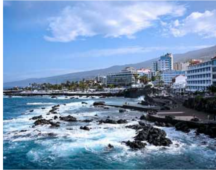
↑ Puerto de la Cruz

In La Laguna - einstige Hauptstadt und heute UNESCO-Welterbe - weht kolonialer Geist durch die Straßen. Cafés und Restaurants laden zum Verweilen. Ebenfalls einen Stop wert: La Orotava . Elegante Herrenhäuser mit kunstvollen Holzbalustraden, blühende Gärten und Kopfsteinpflaster verleihen dem Ort ein ganz eigenes, historisches Flair.