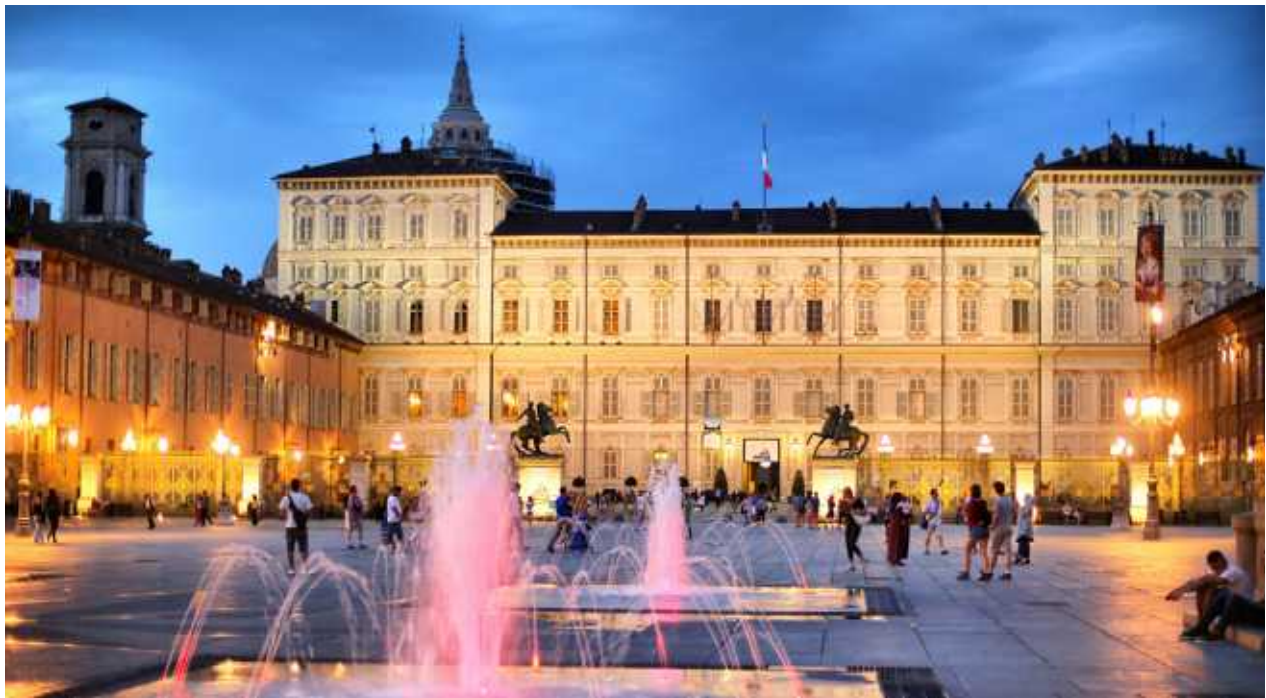
↑ Geschäfte, Cafes, Opernhaus und der königliche Palast der Savoyer: Die Piazza Castello ist so etwas wie das Herz der Stadt