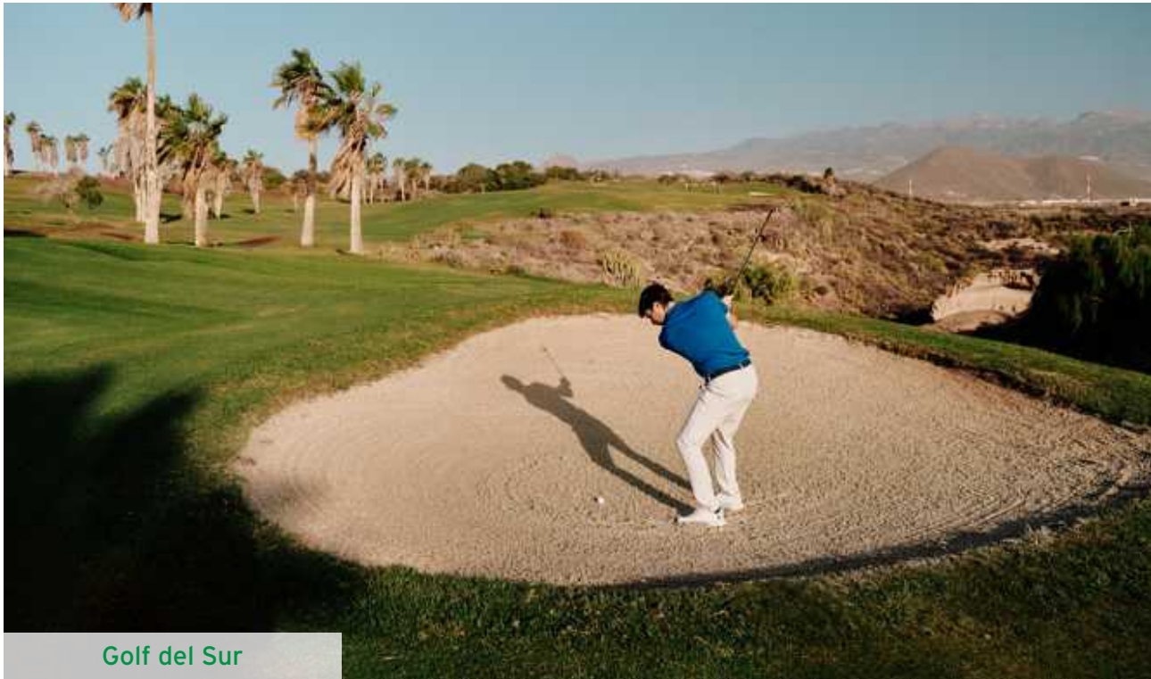
Golf del Sur

hindernissen und nicht zu unterschätzenden Bunkern eröffnet sich an fast jedem Loch ein wunderbarer Blick auf den Atlantik.