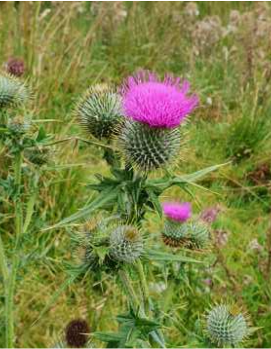
↑ Die Distel, Nationalsymbol Schottlands