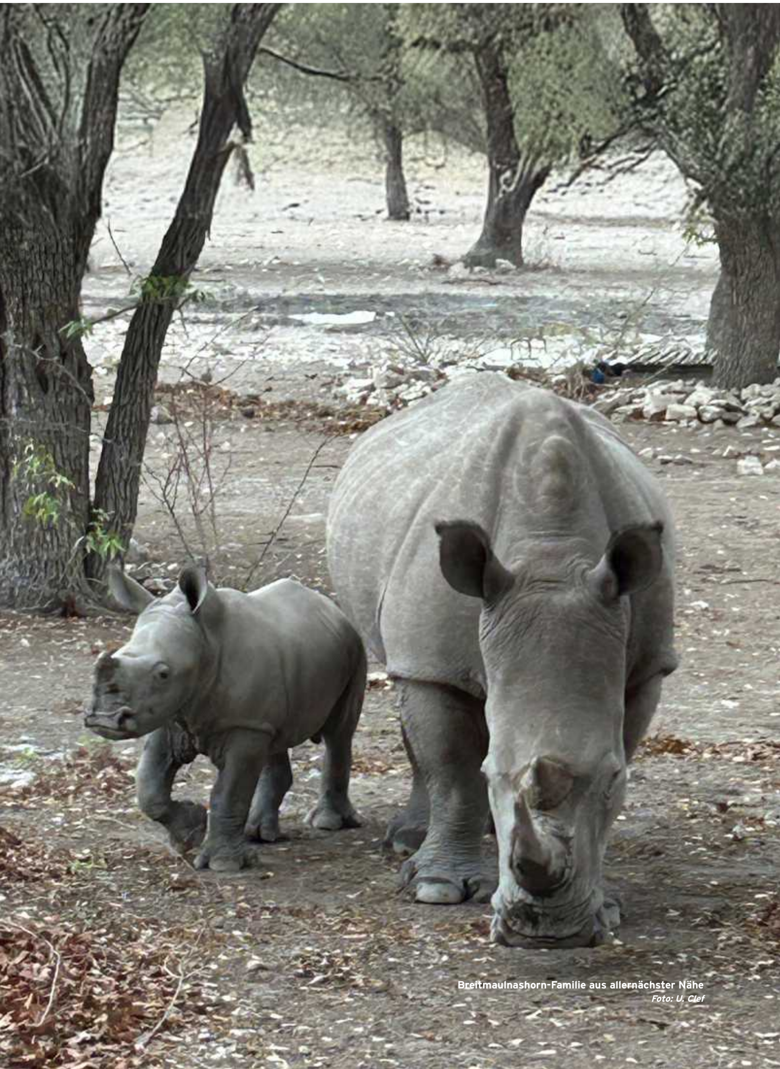
Breitmaulnashorn-Familie aus allernächster Nähe