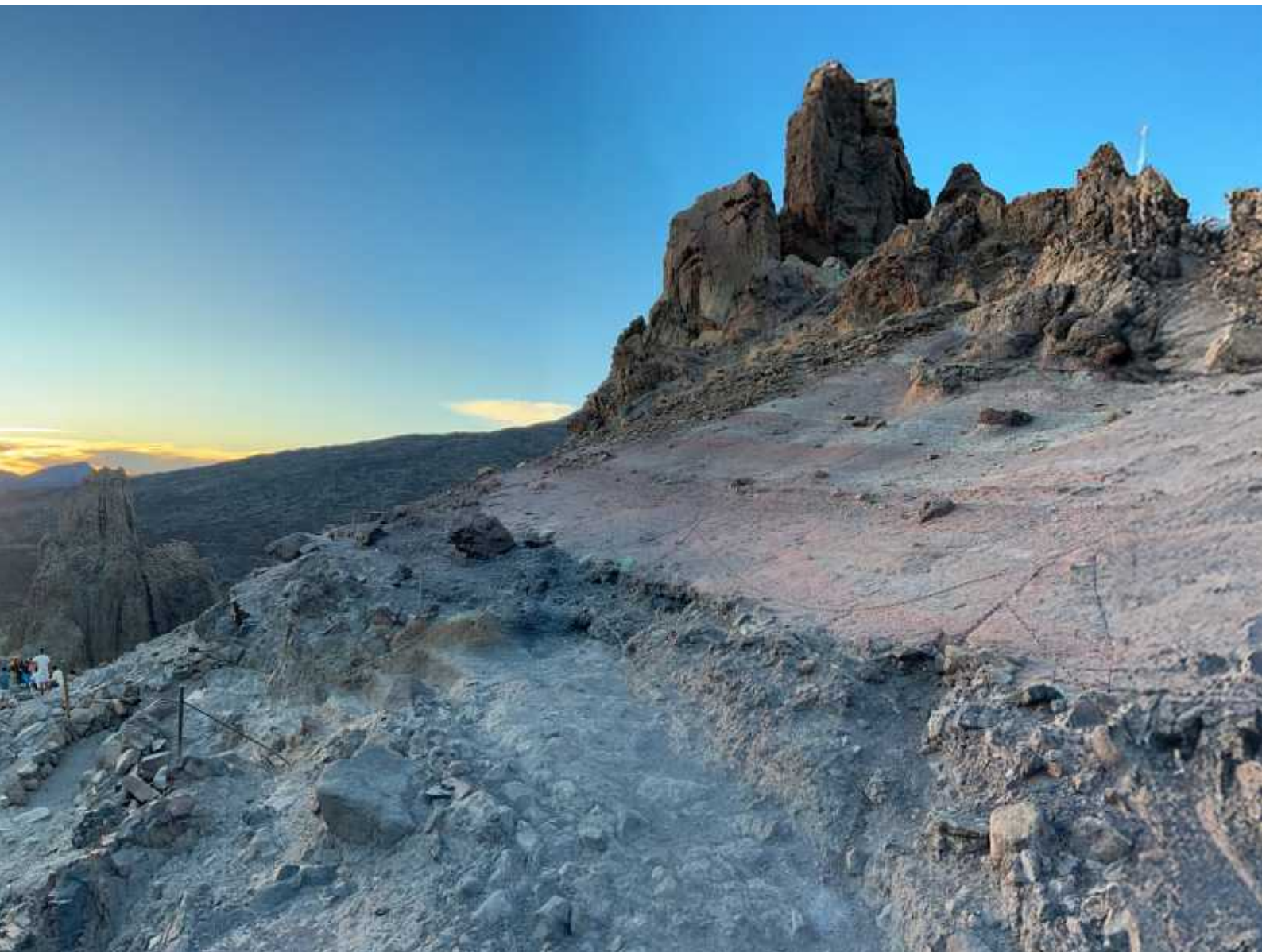
↑ Wanderung am Teide durch längst erkaltete Lava in rund 3200 Meter Höhe

Es ist acht Uhr am Morgen. Die Sonne strahlt wie gewohnt und in der Ferne erhebt sich die Nachbarinsel La Gomera aus dem Meer. Nur Spaniens höchster Berg hat sich hinter dichten Wolken versteckt. Mit dem Auto geht's hinauf über eine kurvenreiche, perfekt ausgebaute Straße - zuerst üppiges Grün in den Wolken, dann klart es auf und es geht durch immer lichter werdende Wälder höher und höher. Der Duft von Harz mischt sich mit trockener Luft - und mit jedem Höhenmeter wird die Vegetation spärlicher bis in rund 2000 Meter über dem Meeresspiegel eine karge, zerklüftete „Mondlandschaft“ erreicht wird. Statt üppigem Grün eröffnet sich eine weite zerklüftete Ebene mit schwarzen, grauen und braunen Tönen, die je nach Sonneneinstrahlung in unzähligen Schattierungen strahlen.