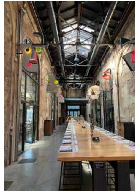
↑ Aus alt mache modern: Das OGR Torino ist ein bedeutendes Innovationszentrum Italiens, es wurde in alten Eisbahnwerkstätten eingerichtet. ↑