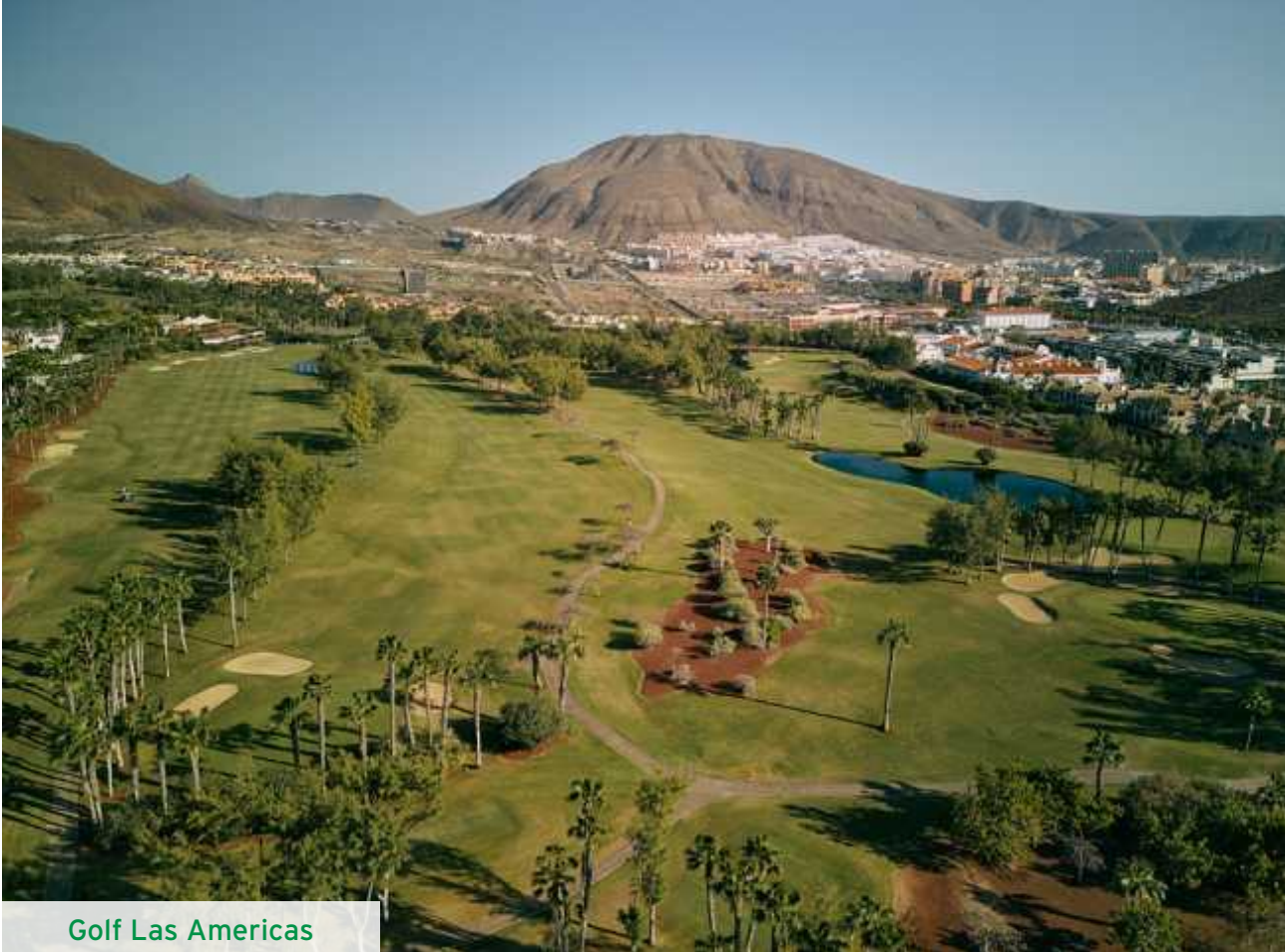
Golf Las Americas

ne machen ihn bei Langzeit-Urlaubern beliebt - viele von ihnen überwintern in dieser Gegend.