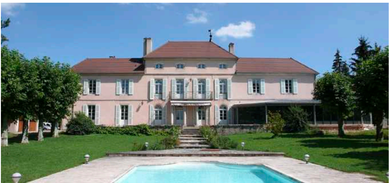
↑ Château Hôtel du Mont Joly

Sind Luxusprodukte wie Foie gras, Kaviar oder Trüffel für Sie unverzichtbar? Nicht unverzichtbar, aber manchmal notwendig. Foie gras ist für mich ein festliches Produkt, Symbol für Teilen und Genuss. Trüffel – ja, das muss man sagen – schmeckt einfach fantastisch. Sie hebt einfache Gerichte auf ein anderes Niveau – ein pochiertes Ei in Comté-Milch mit geraspelter Trüffel bekommt so eine ganz neue Dimension. Und wenn man vergleicht: Ein Trüffelrisotto ist oft günstiger als Jakobsmuscheln zu Weihnachten. Der Luxus entsteht durch Seltenheit und Saisonalität. Kaviar hingegen ist purer Luxus – ein nicht veredelbares Produkt, das wie ein Juwel ein Gericht adelt.