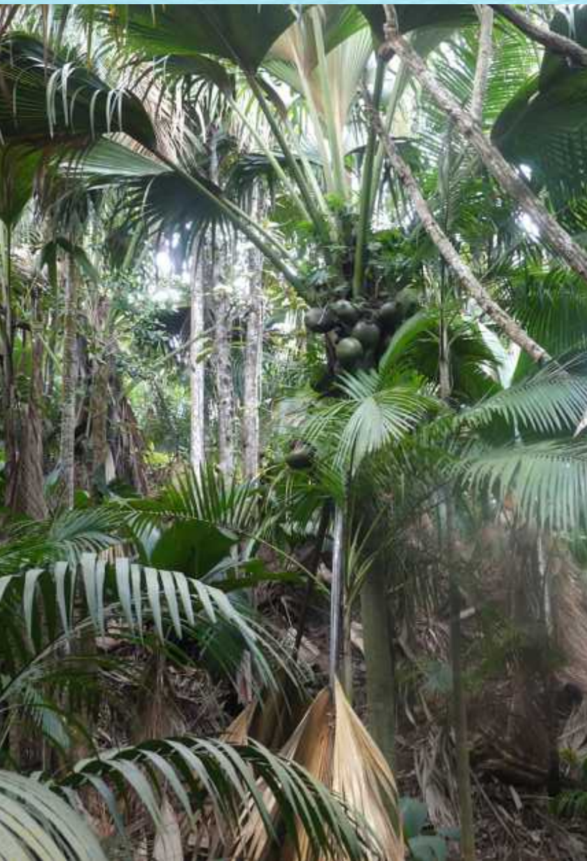
↑ Vallée de Mai und eine Coco de Mer ↓