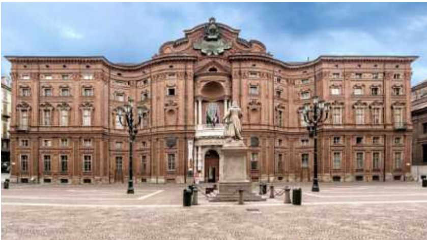
↑ Meisterwerk der Barockarchitektur: Im Palazzo Carignano tagte zwischen 1861 und 1865 das erste italienische Parlament. Er war die Residenz der Fürsten von Carignan, und ist heute das Nationalmuseum.