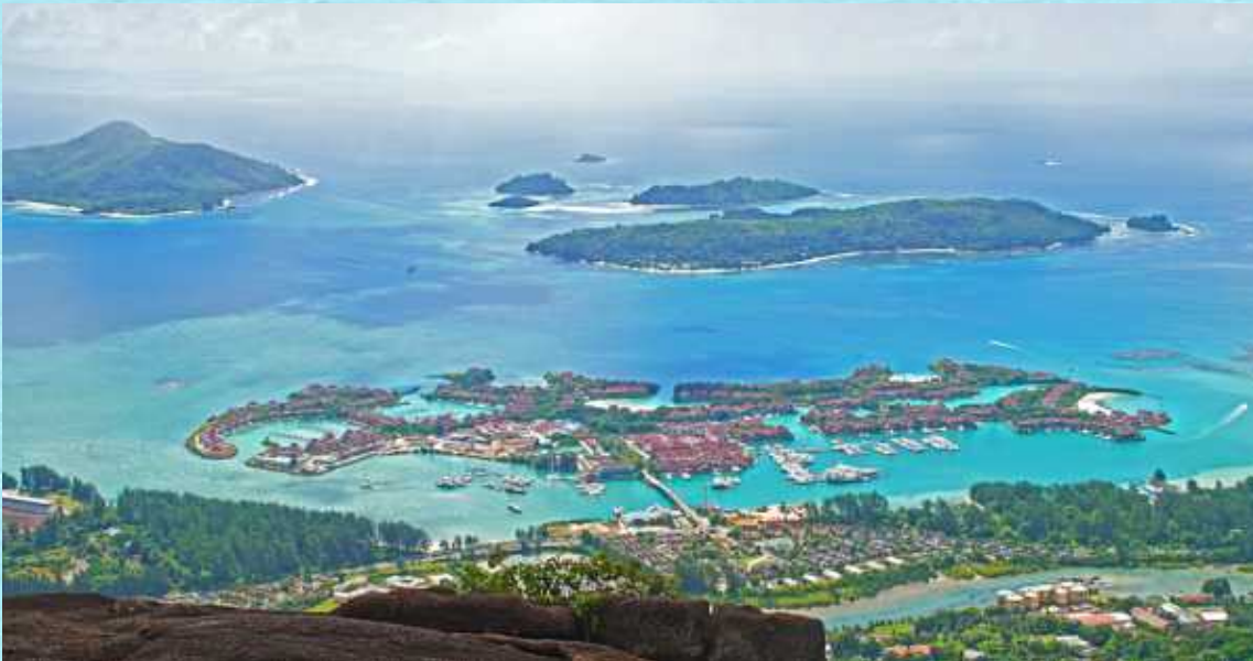
← Blick aus den Bergen ↑ Victoria mit dem künstlich angelegten Eden Island und dem vorgelagerten Sainte Marine National Park

Aussichtspunkten, von denen aus sich der Ozean wie ein gemaltes Panorama öffnet. Enge, aber gute Serpentinstraßen führen zum Beispiel in die bergige, dschungelartige Landschaft des Morne Seychellois Nationalpark.