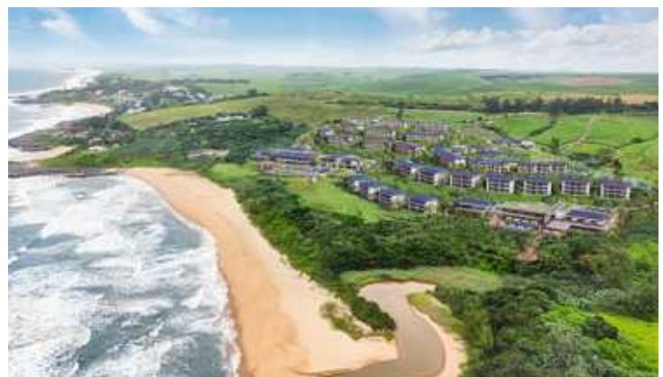
Der neue Club Med in Südafrika

Die Besonderheit bei diesem Angebot ist die Kombinationsmöglichkeit von Strandurlaub mit einer Safari in der rund 300 Kilometer (knapp fünf Stunden mit dem PKW bzw. mit einem kleinen Charter-Flugzeug) entfernten ebenfalls neuen Mpilo Safari Lodge, gelegen in einem 18.000 Hektar großen, re-