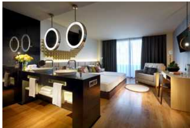
Impressionen aus dem Hard Rock Hotel Tenerife