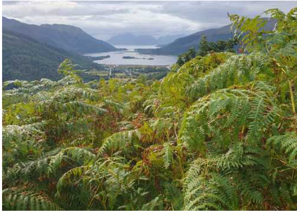
↑ Aufstieg zum Pap of Glencoe

Weg steigt kontinuierlich an und lässt die Wanderer immer mehr staunen, was für ein breites Tal sich das Flüsschen im Lauf der Jahrhunderte ausgewaschen hat. Rinder- und Schafherden grasen in den Auen. Nahe Crianlarich wechseln sich uralte Kiefern und junge Aufforstungen dort ab, wo Bäume von den heftigen Herbststürmen umgerissen wurden. Im Wald wuchern irrsierend grüne Moospolster zwischen den Stämmen.