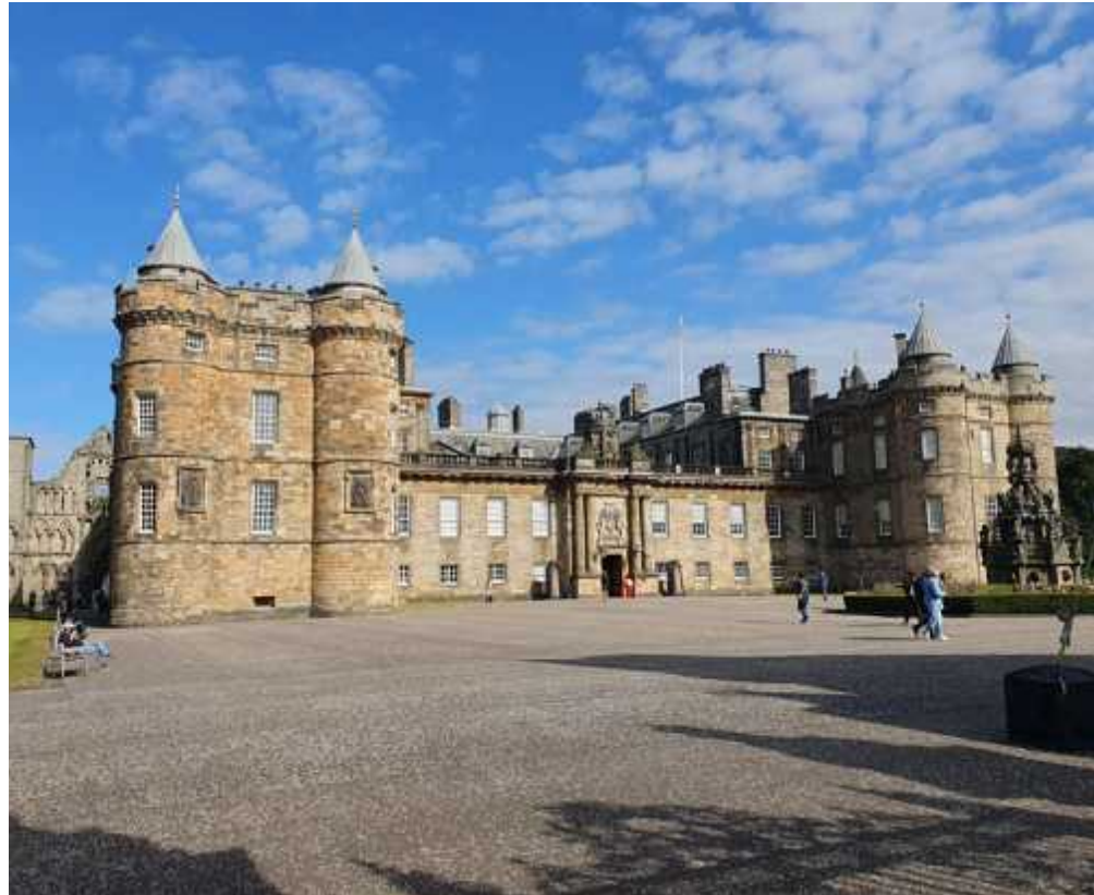
↑ Holyrood Palace in Edinburgh

zehn very british eingerichteten Cottages mieten. Wenn Charles III und Queen Camilla, Princess Anne und andere Royals vor Ort sind, nehmen sie auch gelegentlich den Tee im Five Arms und besuchen die kleine Dorfkirche Crathie Kirk nahe des Schlosses. Und dann kann es dem zufällig Vorbeikommenden – wie dem Autor – passieren, dass ihm der Regent und seine Gemahlin vom Rücksitz ihres weinroten Bentleys huldvoll zuwinken.