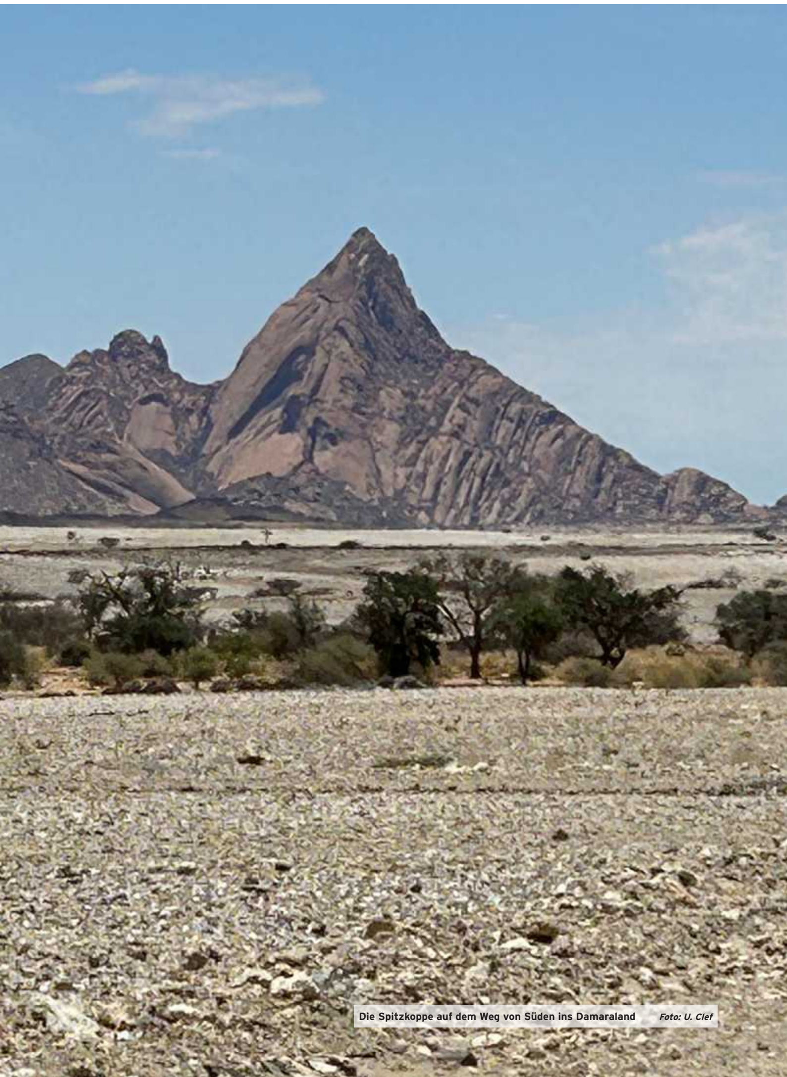
Die Spitzkoppe auf dem Weg von Süden ins Damaraland