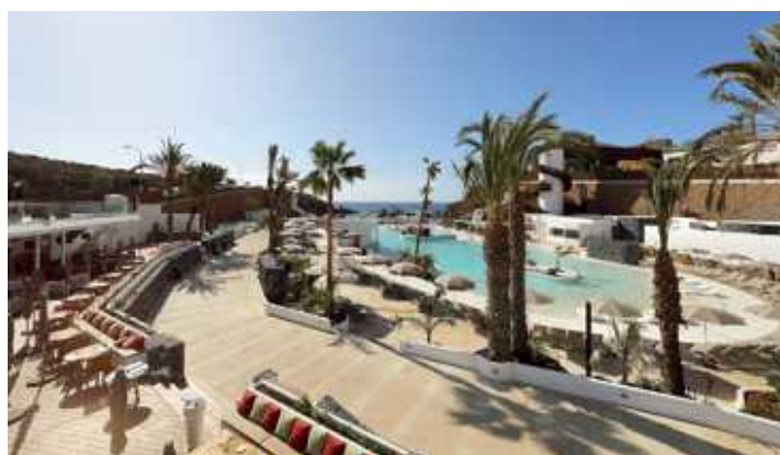
Impressionen aus dem Hard Rock Hotel Tenerife