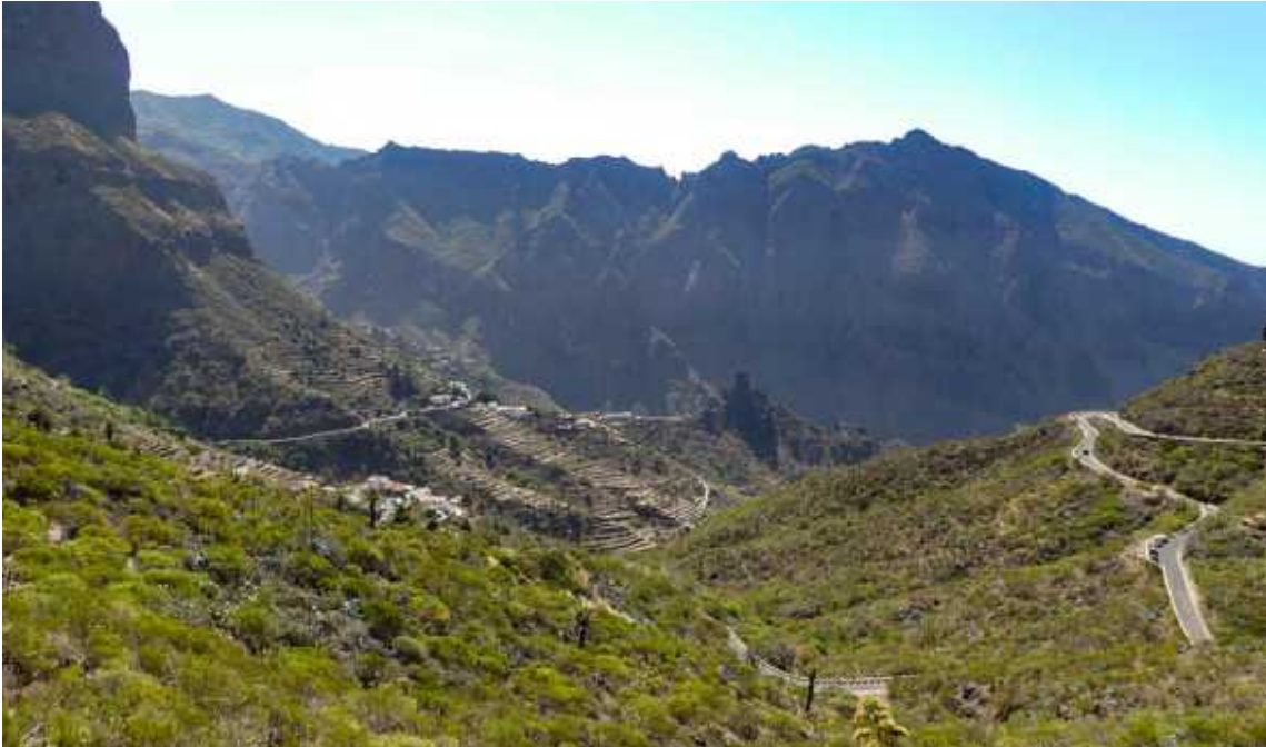
↑ Masca-Schlucht ↓