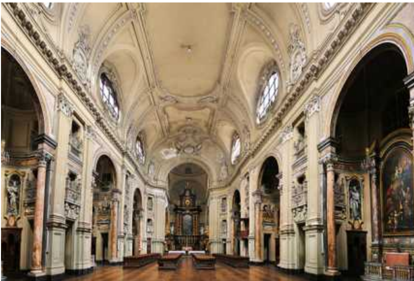
↑ San Filippo Neri ist die größte Kirche Turins und liegt in der Nähe von Palazzo Carignano und Piazza Castello. ↓ Mit Ross und Reiter: Die Waffenkammer des Palastes ist bei Touristen wegen ihrer Anschaulichkeit sehr beliebt.