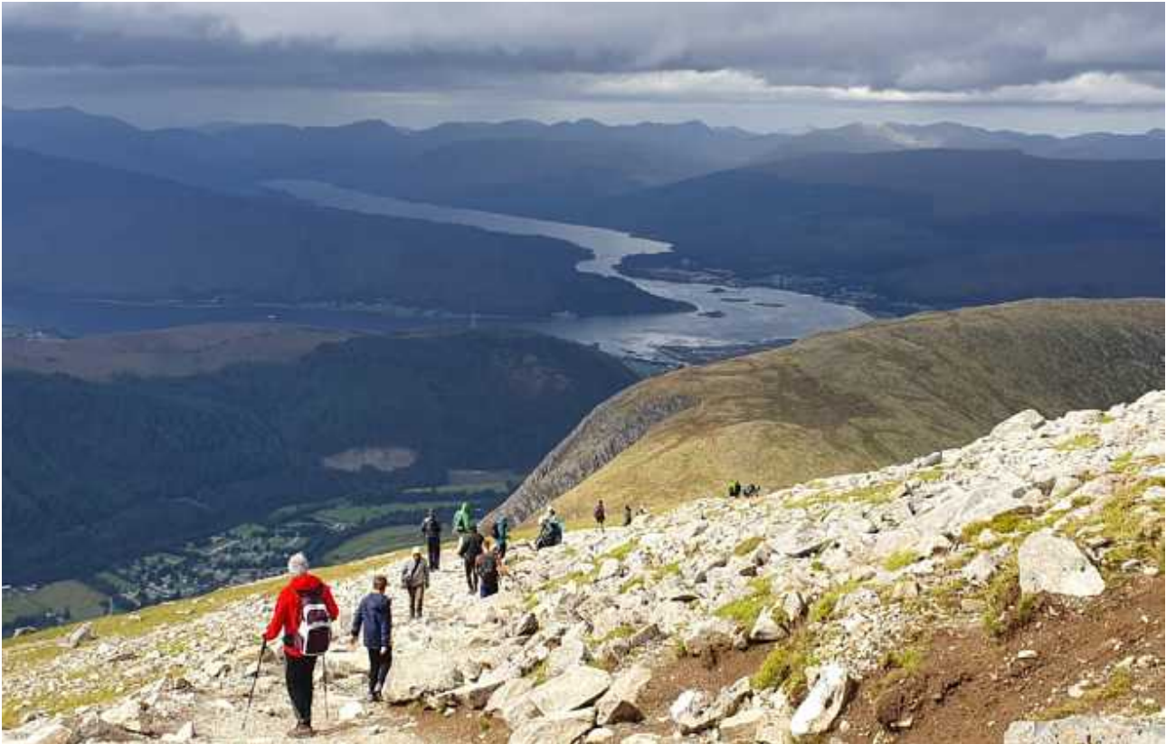
↑ Aussicht vom Ben Nevis

schaffen. Das Fife Arms Hotel in Braemar ist ein Quartier, das seine Gäste ein bisschen ins Filmset von Downton Abbey versetzt. 1856 als Postkutschenstation eröffnet war es von Anfang an ein Wahrzeichen des kleinen Ortes. Seine derzeitigen Eigentümer, die Inhaber der Galerie Hauser & Wirth, lieben das denkmalgeschützte Anwesen bis ins kleinste Detail restaurieren und beauftragten dafür lokale Handwerker, Künstler und Designer. So entstand zum Beispiel ein hauseigener Tweedstoff mit individuellem Tartanmuster, inspiriert von den jahreszeitlich wechselnden Farben der umgebenden Landschaft, mit dem die Wände bespannt sind. Aus ihrem riesigen Fundus statteten die Galeristen und Sammler die öffentlichen Räume, Gästezimmer und Flure mit 16.000 Antiquitäten und Kunstwerken aus, von denen viele eigens angefertigt wurden. Für die 8,80 mal 6 Meter messende Decke des Drawing Room zum Beispiel schuf der chinesische Künstler Zhang Enli das farbenfrohe Gemälde „Ancient Quartz“. Darunter hängt das Werk „Weiblicher Akt und Mann mit Pfeife“ von Pablo Picasso – das Original.