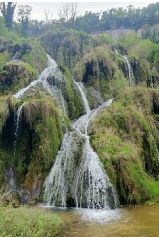
↑ Cascades des Tufs Romuald Fassenet →

Fotos dieser Reportage: H. Meyer Foto folgende zwei Seiten: R. Fassenet