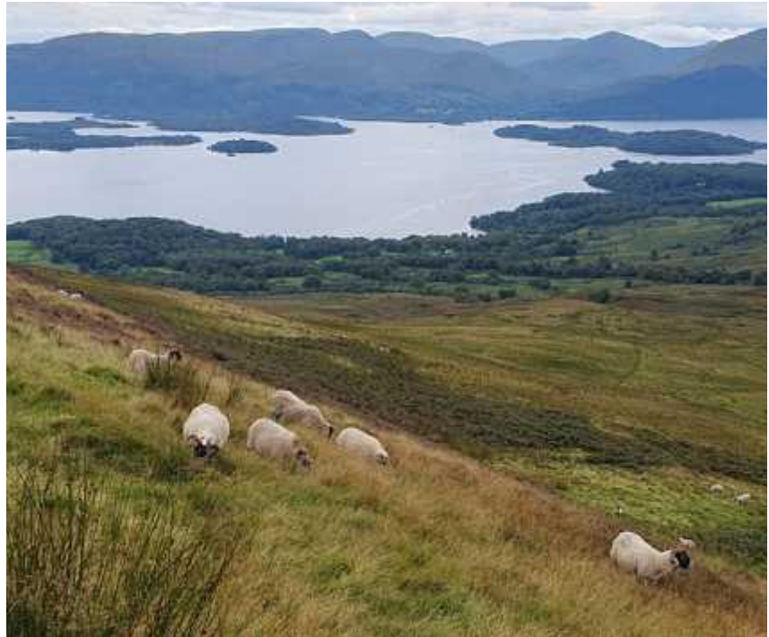
↑ Blick vom Ben auf den Loch Lomond

Wer sich vorbereitet, also rechtzeitig eingesprüht hat, kann unbeschwert zur Tages-tour hoch zum Ben – schottisch für Berg – Lomond starten. Und kaum hat man den dichten Eichenwald verlassen und ist in offenem Gelände mit leichtem Wind unterwegs, sind die Plagegeister auch schon wie vom Erdboden verschwunden. Dagegen werden die Ausblicke auf Schottlands nicht nur größten, sondern auch schönsten See immer spektakulärer: Im Süden liegen acht größere und je nach Wasserstand bis zu 22 kleinere bewaldete Inseln auf dem