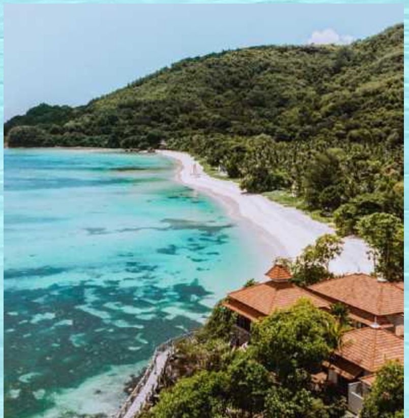
↓ Der ruhige Strand des Club Med