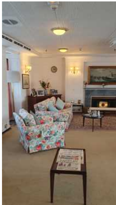
↑ Auf der königlichen Yacht Britannia