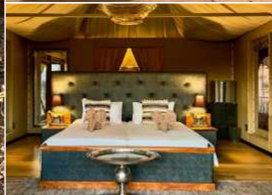
↑ Twyfelfontain Adventure Camp