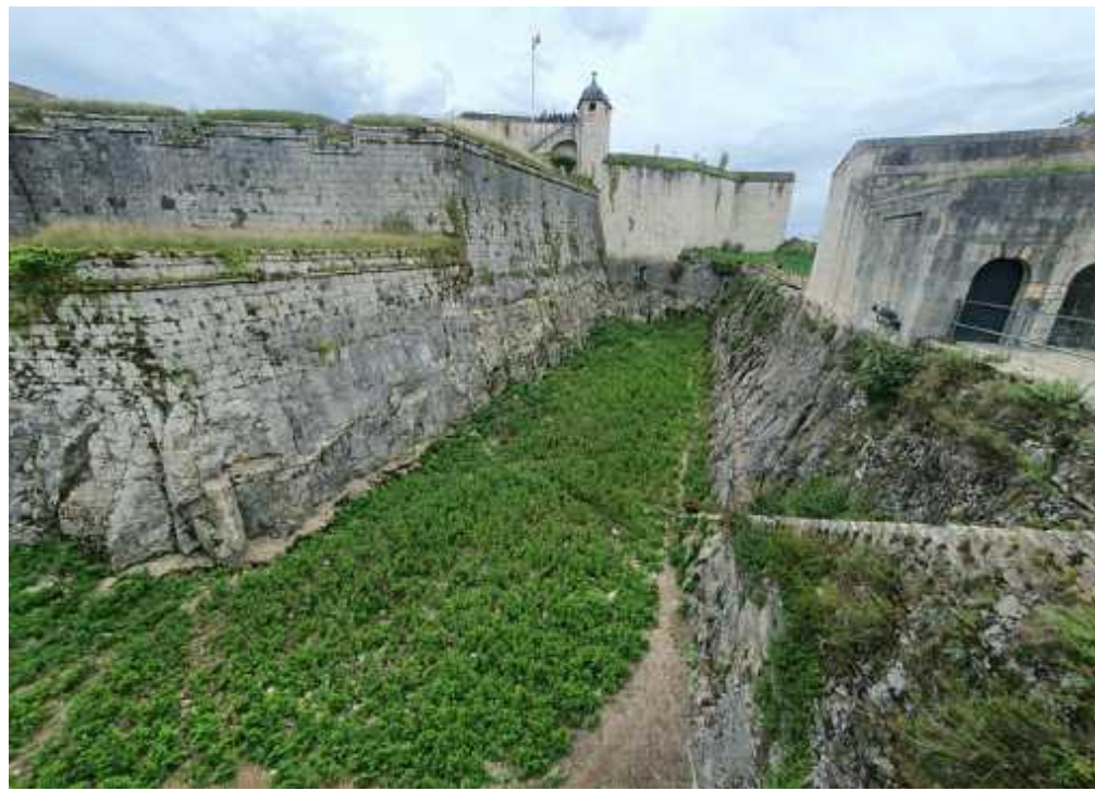
↑ Graben der Zitadelle von Besançon

bestens aufgehoben. Oder man folgt im früheren Sitz der Grafen von Burgund auf eigene Faust den Wegweisern aus Messing, die in die Gehsteige eingelassen sind. Dabei stehen ihre unterschiedlichen Symbole für das spezifische Thema des jeweiligen Spazierwegs durch das 24.000-Einwohner-Städtchen am Fluss Doubs. Die Dreiecke mit dem Kater zum Beispiel leiten in gemütlichen eineinhalb Stunden auf vier Kilometern durch das Zentrum, wo sich die Rue de la Sous-Préfecture als Startpunkt anbietet. Am Haus mit der Nummer 3 schuf eine Gruppe von vier Künstlern 2017 ein Fresko, das eine komplette fensterlose Wand einnimmt. Das – getäuschte – Auge des Betrachters allerdings will mehrere Fensteröffnungen sehen, einen Balkon und im Erdgeschoss ein Schaufenster. Das alles ist ebenso nur aufgemalt wie die fotorealistischen Figuren namhafter Persönlichkeiten aus Dole.