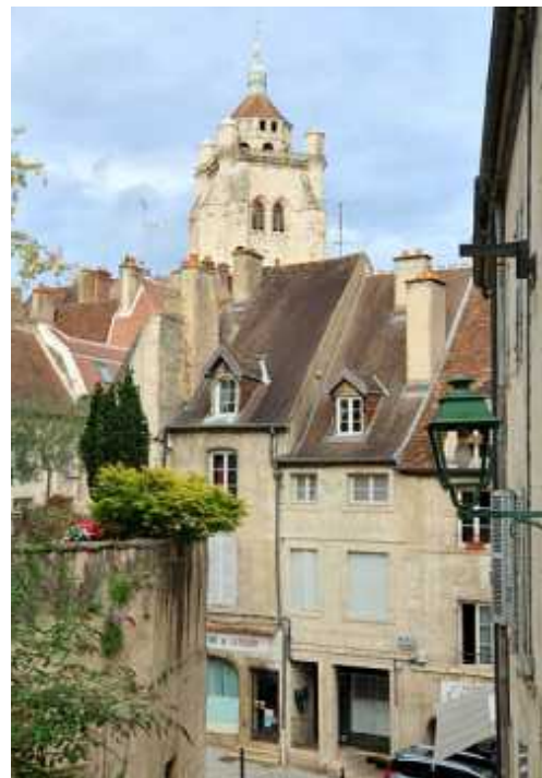
↑ Dole mit seiner Stiftskirche Notre-Dame

den im Juli und August die spektakuläre Show Lux salina statt. Dabei beleben bewegte Bilder in riesigen Formaten, blendende Lichteffekte, große Feuer und ein Soundtrack des Filmmusikkomponisten Bruno Coulais die ebenfalls als Welterbe anerkannte Architektur und die „beweglichen Gärten“ der Saline Royale. Wer buchstäblich eintauchen möchte, nutzt die Wellnessangebote des 2017 eröffneten Thermalbads in Salins-les-Bains, die Therma Salina.