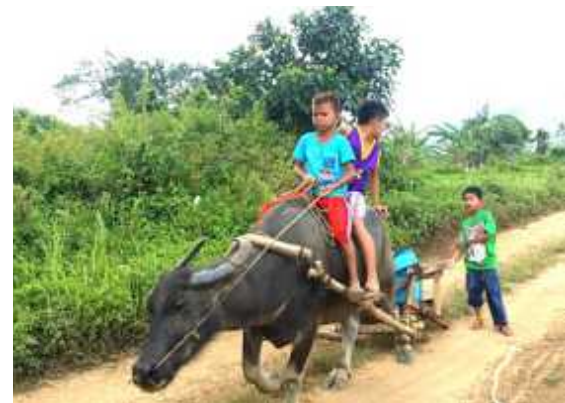
←← Chocolate Hills ← Cebu Amazing Graze →→ Siquijor Hotel Resort →