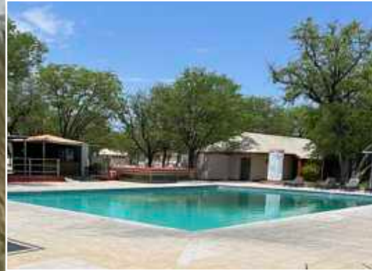
Etosha Obeland Lodge