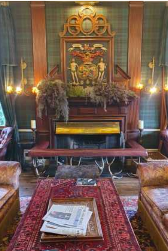
↑ Five Arms Hotel in Braemar