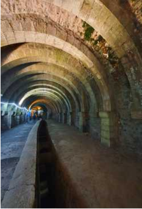
↑ Große Saline von Salins-les-Bains