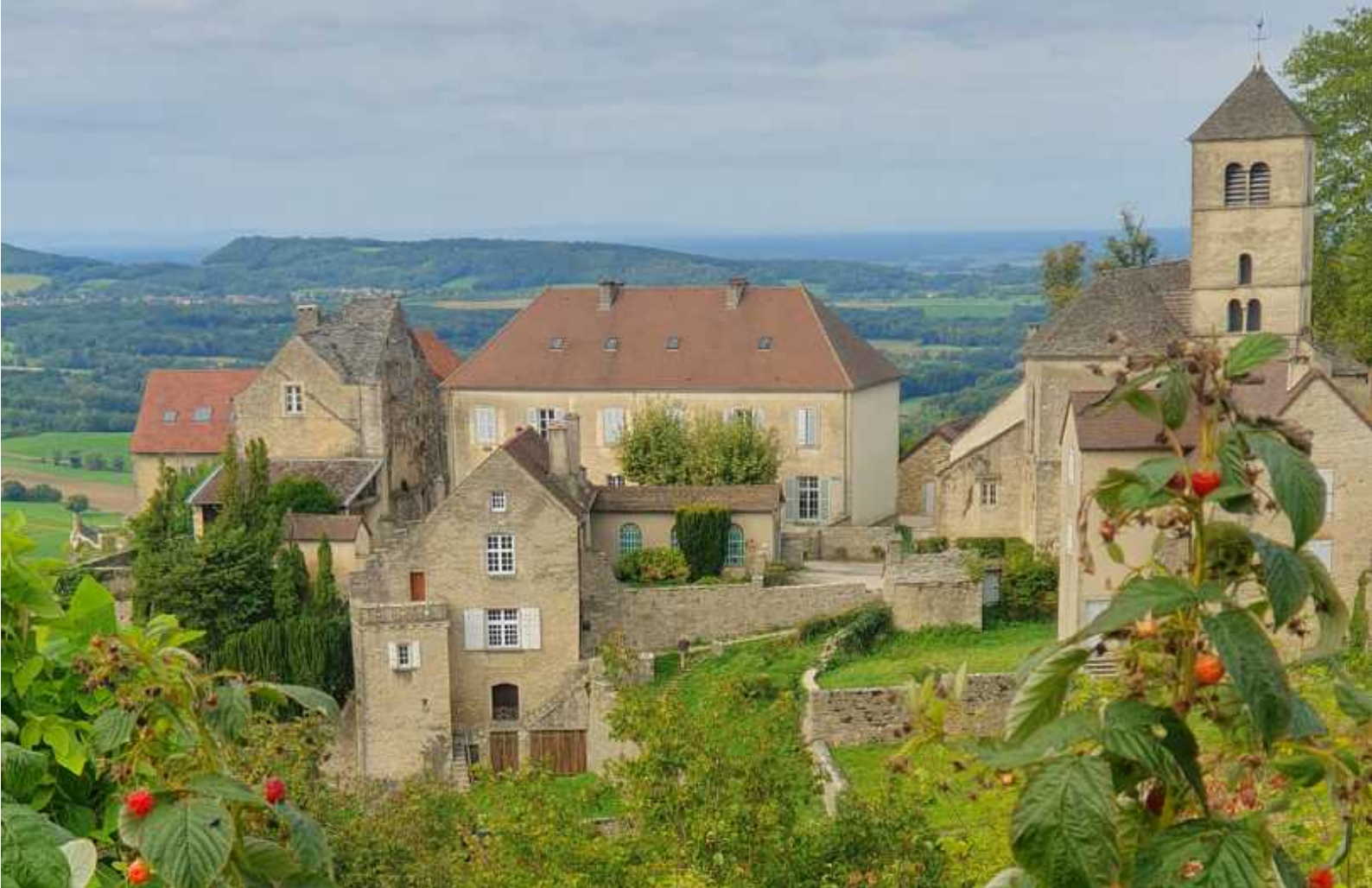
↑ Château-Chalon wacht über das Tal der Seille

Eugenic. Jeder Liter Sole war mit 330 Gramm Salz gesättigt, ein höherer Wert als im Toten Meer.