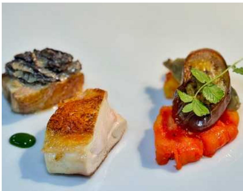
Das Bild zeigt das Gericht ergänzt durch Tomatencoulis mit Aubergine

Die Knochen aus dem Geflügel entfernen, das Fleisch portionieren und die Morcheln hinzufügen. Die Sauce mit etwas Butter aufschlagen und abschmecken. Etwas Vin jaune hinzufügen und über das Huhn gießen.