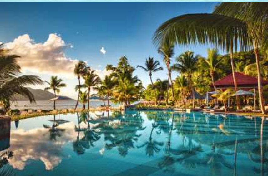
↑↑ Wassersport am Strand und Pool Area für Erwachsene ↑ ↓ Entertainment bei der Weißen Nacht