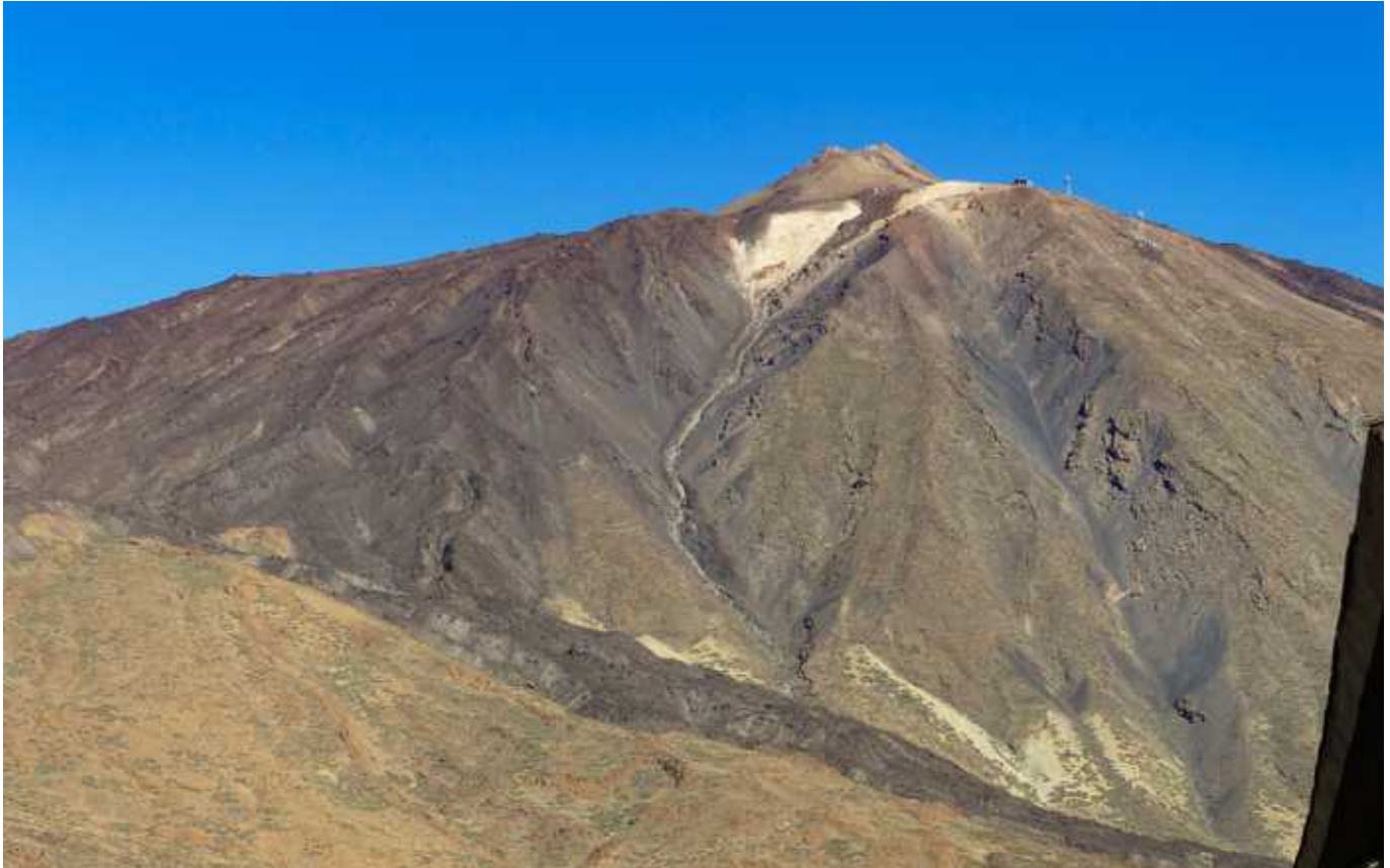
↑ Der Teide